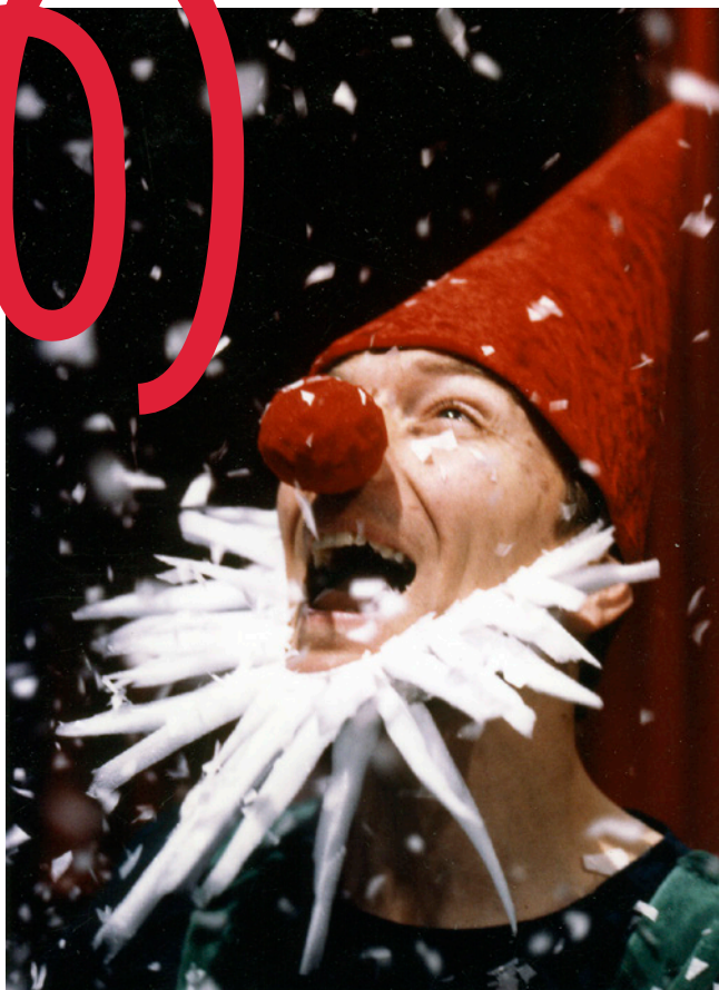
Talvisirkus, vuosi 1996

Talvisirkuksen katsomossa kohtaa usein monta sukupolvea: isovanhemmat, vanhemmat, nuoret ja lapset. Pääosin sanattoman tarinankerronnan ansiosta Talvisirkus on kaikkien ulottuvilla ja sopii hyvin kaikenkielisille katsojille. Esteettömyyteen on kiinnitetty huomiota ja katsomosta löytyy pyörätuolipaikkoja.