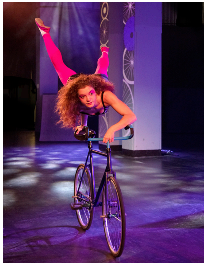
Talvisirkus Vauhti, vuosi 2021